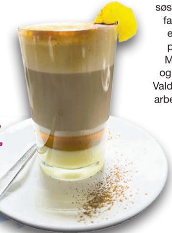
En "Barraquito" består av lag med kondensert melk, liker, espressokaffe og kaffekrem.....mmmm!